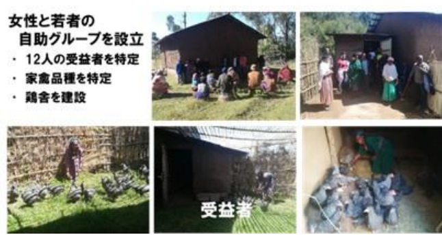
写真13. グダル小流域における養鶏による収入創出に関する活動