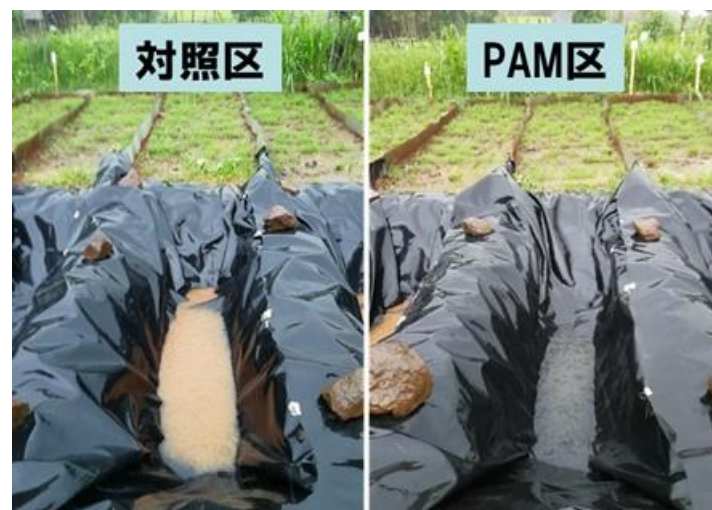
写真2. 土壌流出に対する土壌改良剤の効果

土壌侵食防止手法の開発については、3つの研究対象地で実施した土壌流亡プロット実験において、耕作地における土壌侵食防止技術としてポリアクリルアミド(PAM)の効果が確認された(写真2)。さらに、ポリアクリルアミド(PAM)、石膏(Gypsum)、石灰(Lime)およびPAMと他の土壌改良剤の混合物の実験処理区を設定し、テフ作物の成長度合いを比較した。結果から、PAM区および石膏区と比べ、石灰区ではテフの成長高が高くなった。PAMと石灰の混合区ではテフの成長高が高くなり、石灰のみの区と比較してもPAMと石灰の相乗効果が明確にみてとれた。また、バハルダール大学に設置した降雨シミュレーターを用いて、3つの小流域の土壌について流亡実験を行い、ポリアクリルアミド(PAM)などの凝固剤・高分子凝集剤の土壌流亡制御への効果を検証している。【Activity 1.3】