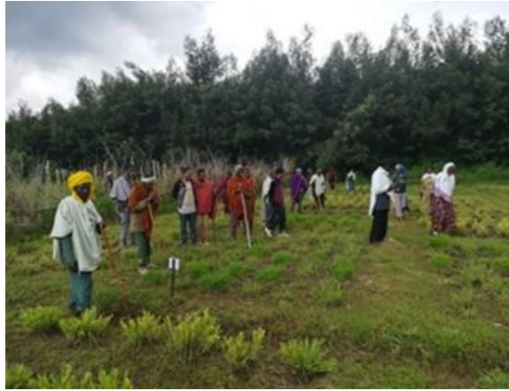
写真 14. ステークホルダーによるの研究サイト視察

地域 SLM イノベーションプラットフォームおよび各小流域の地区 SLM イノベーションプラットフォームの集会を開催し、ステークホルダーによる研究サイト視察を行った(写真 14)。SLM アプローチの開発については、生態的利益型、経済的利益型、最適な生態・経済的利益型の3つの土地管理シナリオ案を作成した。また、次世代型 SLM のガイドラインおよび普及マニュアルの作成を検討した。【Activity 4.1、4.2、4.3】