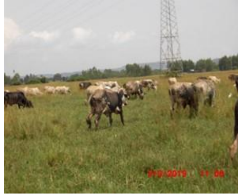
写真9. 放牧家畜の摂取エネルギー評価