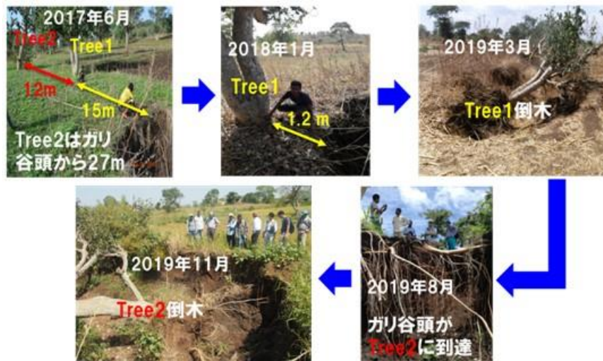
写真3. ドゥバテ小流域におけるガリ谷頭の