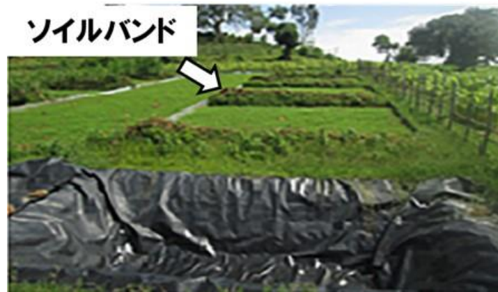
写真1. 実験プロットの土堤区「ソイルバンド」

土壌侵食防止手法の開発については、3つの研究対象地で実施した土壌流亡プロット実験において、耕作地における土壌侵食防止技術としてポリアクリルアミド(PAM)の効果が確認された(写真2)。さらに、ポリアクリルアミド(PAM)、石膏(Gypsum)、石灰(Lime)およびPAMと他の土壌改良剤の混合物の実験処理区を設定し、テフ作物の成長度合いを比較した。結果から、PAM区および石膏区と比べ、石灰区ではテフの成長高が高くなった。PAMと石灰の混合区ではテフの成長高が高くなり、石灰のみの区と比較してもPAMと石灰の相乗効果が明確にみてとれた。また、バハルダール大学に設置した降雨シミュレーターを用いて、3つの小流域の土壌について流亡実験を行い、ポリアクリルアミド(PAM)などの凝固剤・高分子凝集剤の土壌流亡制御への効果を検証している。【Activity 1.3】