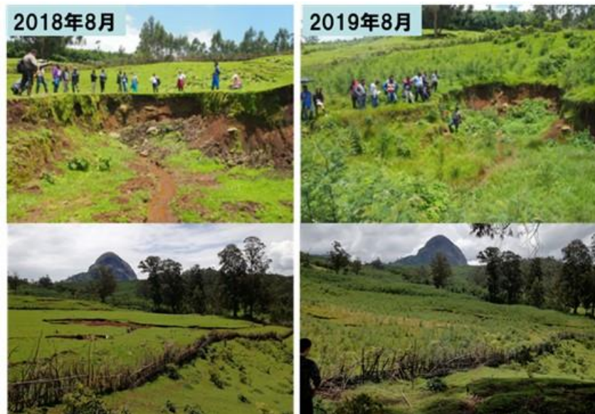
写真4. グダル小流域におけるガリの修復