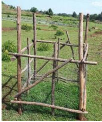
写真8. 移動式ケージ