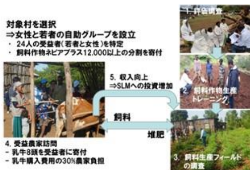
写真12. アバガリマ小流域における酪農による収入創出に関する活動