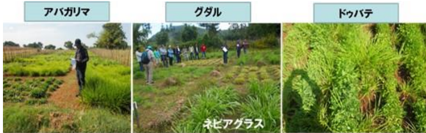
写真10. 飼料用の牧草生産圃場試験

劣化地の土地修復に関する研究活動については、アバガリマおよびグダルの小流域において、禁牧効果の評価のために、禁牧地と隣接劣化地の植生・土壌調査を実施した(写真 11)。土壌劣化回復技術に関しては、アバガリマ小流域およびグダル小流域の土地劣化が進行している傾斜地において、植林による土地修復実験を開始した。また、土壌に埋没している種子の発芽試験および土壌分析を行った。【Activity 2.4】